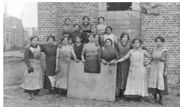
fot. robotnice przy pracy w hucie „BAILDON”, 1915 r.