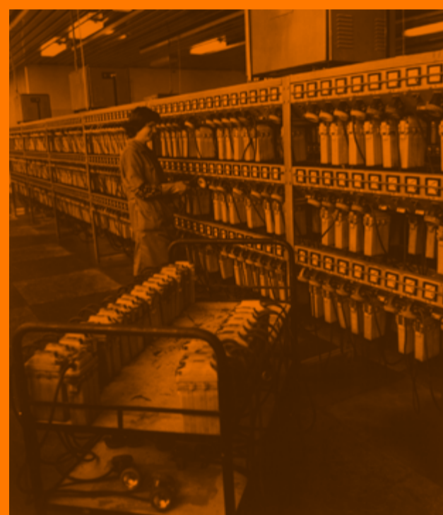
Dobrego końca budowa kopalni ZMP w Rybnickim Okręgu Węglowym, która zostanie uruchomiona na tegoroczną Barbarkę. Na zdjęciu – przygotowanie lampy do przekazania fot. St. Jakubowski

Archiwum Państwowe w Katowicach 12/1793/Z IV 2091