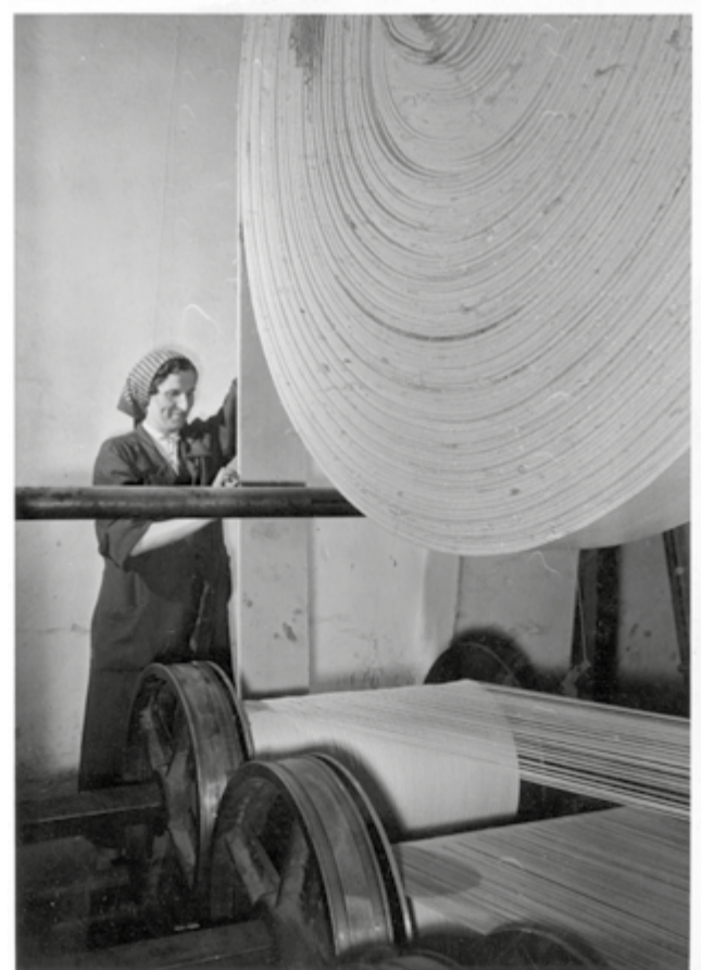
fot. nieznaną zakład pracy, włókiennictwo, przędzalnie lata 60. XX w., K. Seko, ze zbiorów Muzeum Historycznego w Bielsku-Białej