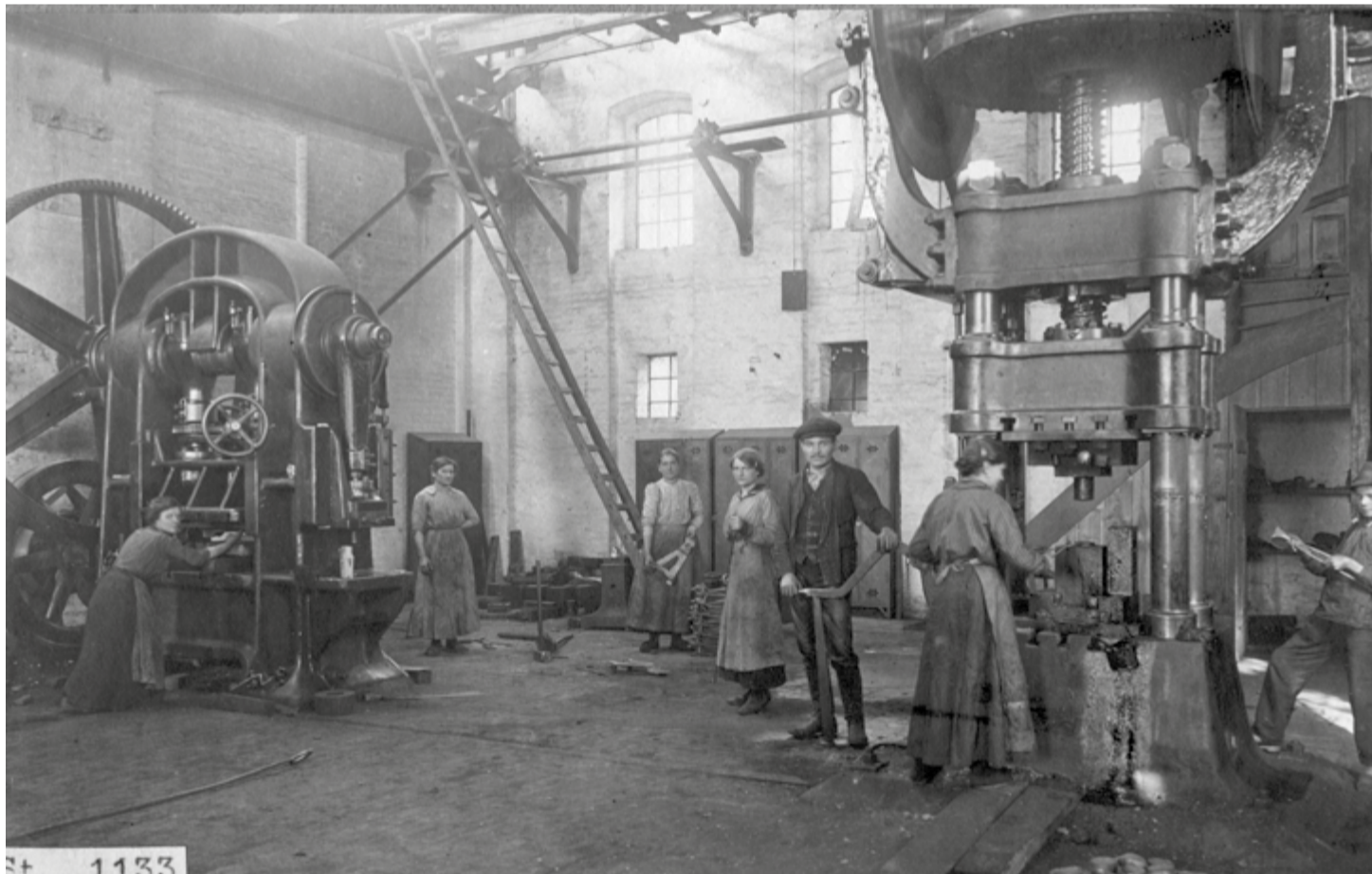
fot. robotnice przy pracy w hucie „BAILDON”, 1915 r.

Finał INDUSTRIADY, po raz pierwszy organizowany poza aglomeracją, też zapowiada się imponująco.