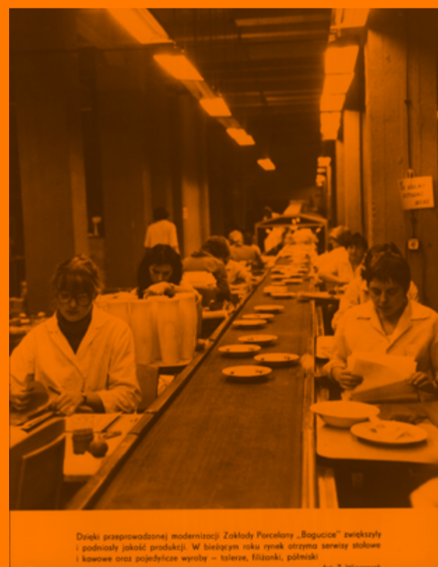
Dzięki przeprowadzonej modernizacji Zakłady Porcelany „Bogusica” zwiększyły i podniosły jakość produkcji. W bieżącym roku rynek otrzyma serwis stolowy i kawowe oraz pojedyncze wyroby – talerze, filiżanki, półtęści