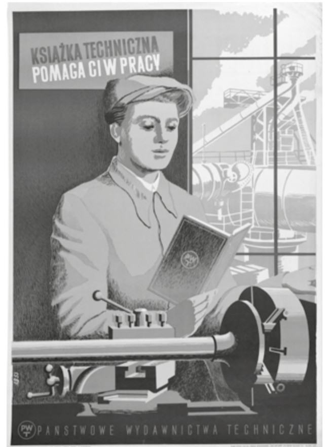
fot. „Kobieta przy pracy” – plakat Ze zbiorów Muzeum Górnośląskiego w Bytomiu