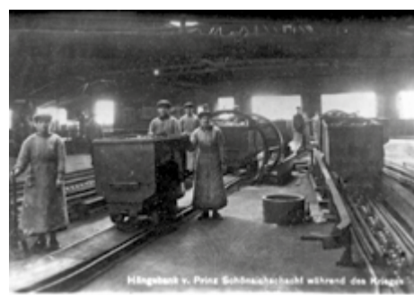
Praca kobiet w kopalni Królowa Luiza w Zabrze nadszycie szybu Prinz Schönaich oraz fragment kopalnianej sortowni