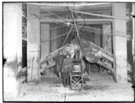
fot. Archiwum Państwowe w Katowicach 12/492/1145

Wydarzenie łączy projekcję obrazów i filmów z ilustracją muzyczną w wykonaniu zespołu DARKEST BIRDS, przedstawiając EC Szombierki w różnych kontekstach kulturowych i społecznych. Projekt jest elementem wydarzenia „Kobieca przestrzeń kultury” w hali maszyn Elektrociepłowni. Liczba miejsc ograniczona. Na wszystkie wydarzenia wstęp wolny