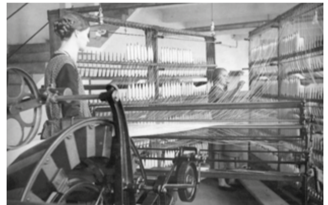
fot. Snucie osnowy, lata 30. XX w. Ze zbiorów Muzeum Historycznego w Bielsku-Białej