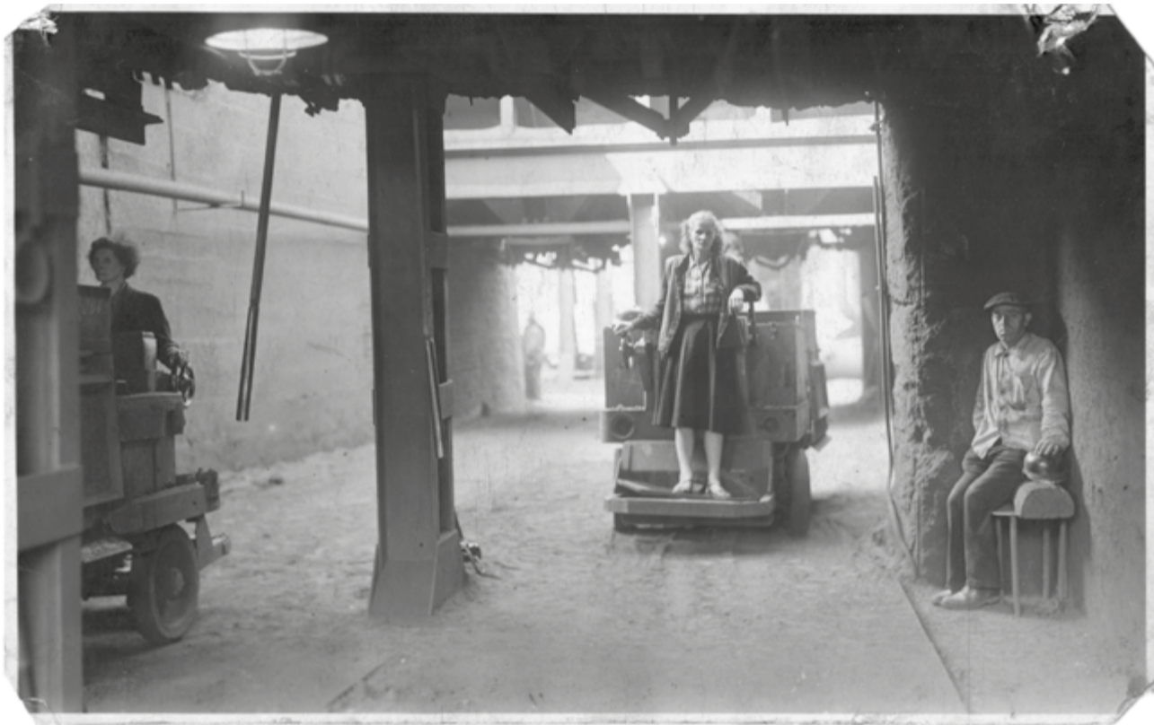
fot. Wielkie piece, prace przy zasiękach wsadowych – transport wsadu wielkopieczowego do windy.

– przywilej górniczy wydany w 1528 roku. Niemal 500 lat później, za sprawą INDUSTRIADY , ruszamy do Zabytkowej Kopalni Srebra w poszukiwaniu kobiety. Pomogą nam między innymi warsztaty, kino, instalacja interaktywna oraz Paulina Przybysz i Brodka .