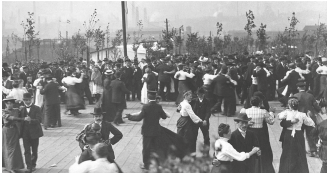
Zabawa górnicza w Chorzowie, górników szybu „Krug” z Kopalni „Król”